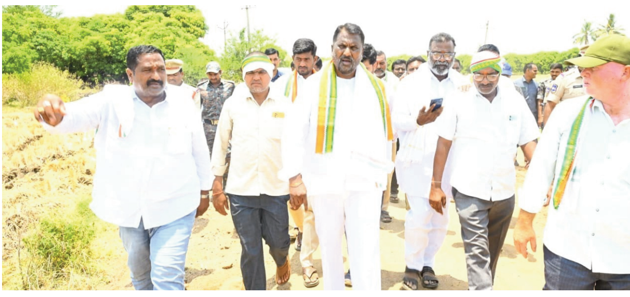
పెగడపల్లి నుండి ఏడు మోటలపల్లి తండా రోడ్డు నిర్మాణానికి స్థానిక రైతులు సహకరించాలని కోరారు. రోడ్డు పనులు త్వరితగతిన పూర్తి చేసి ప్రజలకు అందుబాటులోకి తీసుకురావాలని అధికారులను ఆదేశించారు.

ముద్ర, పెగడపల్లి: గ్రామీణ ప్రాంత రోడ్ల అభివృద్ధికి ప్రత్యేక నిధులు సాధించి ధర్మపురి నియోజకవర్గంలోని ప్రతి గ్రామానికి రవాణా సౌకర్యాలు మెరుగు పరుస్తామని సాంఘిక సంక్షేమ శాఖ మంత్రి అడ్డూరి లక్ష్మణ్ కుమార్ అన్నారు. సోమవారం మంత్రి పెగడపల్లి నుండి ఏడు మోటల పల్లె తండ్ల వరకు రెండు కిలో మీటర్ల మేర రూ.2కోట్లతో నిర్మిస్తున్న రోడ్ల పనులను అధికారులు, స్థానిక ప్రజాప్రతినిధులతో కలిసి పరిశీలించారు. సందర్భంగా మంత్రి అడ్డూరి మాట్లాడుతూ ధర్మపురి నియోజకవర్గంలోని తండాలు మీదుగా ప్రధాన రోడ్లకు అనుసంధానం చేస్తూ లింకు రోడ్లు నిర్మాణం చేయాలని నిర్ణయించినట్లు తెలిపారు. ఇందులో భాగంగా నియోజకవర్గ పరిధిలోని తండాలు మీదుగా రోడ్ల నిర్మాణానికి అంచనాలు తయారు చేయాలని సంబంధిత అధికారులను ఆదేశించారు.