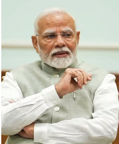
(మొదటి పేజీ కావాలి)

వేసవి కాలంలో పెనరపప్పు శరీరానికి అత్యంత శ్రేష్టమైనది. ఇది శరీరానికి చలవ చేయడమే కాకుండా చాలా తెలికగా జీర్ణం ముఖ్యం.