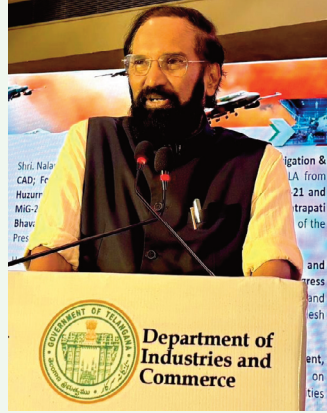
Department of Industries and Commerce

ముద్ర, హైదరాబాద్ : హైదరాబాద్ దేశ రక్షణ రంగానికి కీలక కేంద్రంగా ఎదుగుతోందని మంత్రి కె.కె.ఎస్. ఉత్తమ్ కుమార్ రెడ్డి అన్నారు. ఏరోస్పేస్, డిఫెన్స్ రంగాల్లో తెలంగాణ వేగంగా అభివృద్ధి సాధిస్తోందని, 2024-26 మధ్య ఎగుమతుల్లో 103 శాతం సంయుక్త వాణిజ్య వృద్ధి నమోదు కావడం గర్వకారణమన్నారు. ప్రస్తుతం రాష్ట్రంలో 1500 కు పైగా చిన్న, మధ్యతరహా పరిశ్రమలు రక్షణ రంగానికి భాగస్వాములుగా పనిచేస్తున్నాయని తెలిపారు. హైదరాబాద్ లో జరిగిన ఎంఎస్ఎంఈ సౌఫ్ట్-3.0 కార్యక్రమంలో పాల్గొన్న మంత్రి, భారత్ ఇప్పుడు 100 కు పైగా దేశాలకు రక్షణ సామగ్రిని ఎగుమతి చేసే స్థాయికి చేరుకుందని పేర్కొన్నారు. దేశ రక్షణ రంగానికి కాంగ్రెస్ ప్రభుత్వాలే బలమైన పుణ్యదులు వేనాయని అన్నారు. రక్షణ ఎగుమతులు రూ.686 కోట్ల నుంచి రూ.23,622 కోట్లకు పెరగడం దేశ చురుగ్గా ఉన్న నిదర్శనమన్నారు. ఎ.బి, డ్రోన్ టెక్నాలజీ, సైబర్ సెక్యూరిటీ రంగాల్లో తెలంగాణ ప్రభుత్వం ప్రత్యేక దృష్టి సారినోందని మంత్రి వెల్లడించారు.