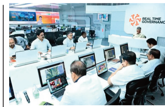
బిటిలో ప్రాడెక్సు పర్మిట్ క్లస్టర్లపై సీఎం చంద్రబాబు నాయుడు సమీక్ష ముద్ర, అమరావతి : ఆంధ్రప్రదేశ్ రాష్ట్రంలో తయారయ్యే ఉత్పత్తులు గ్లోబల్ బ్రాండ్లుగా ఎదిగేలా చర్యలు చేపట్టాలని ముఖ్యమంత్రి చంద్రబాబు నాయుడు స్పష్టం చేశారు. రాష్ట్రంలోని పారిశ్రామిక క్లస్టర్లకు రోడ్డు, రైల్, పోర్టు కనెక్టివిటీ ఉండేలా చర్యలు తీసుకోవాలని సూచించారు. ఏపీ సచివాలయంలోని ఆర్టిజిఎస్ కేంద్రంలో సోమవారం ప్రాడెక్సు పర్మిట్ క్లస్టర్లపై సీఎం సమీక్ష నిర్వహించారు. సమీక్షలో భాగంగా విశాఖ ఎకనామిక్ రిజియన్, అమరావతి ఎకనామిక్ రిజియన్, తిరుపతి ఎకనామిక్ రిజియన్ ప్రాంతాల్లో అభివృద్ధి చేయనున్న పారిశ్రామిక క్లస్టర్లపై చర్చించారు. కేంద్ర ప్రభుత్వ కార్యక్రమం భారత్ బియోగ్రీన్ వికాస్ యోజన పథకం (భవ్యపథకం) కింద చేపట్టనున్న పారిశ్రామిక పార్కులు, కెమికల్ పార్కులు అభివృద్ధి పై సీఎం చర్చించారు. 2026-27లో ఏర్పాటు

ముద్ర, హైదరాబాద్ : తమిళనాడులో నటుడు రాజకీయాల్లో ప్రభంజనం సృష్టించగలడని గతంలో ఎం.జి. రామచంద్రన్ నిరూపించగా, తెలుగునాట నందమూరి తారక రామారావు అదే చరిత్రను సృష్టించారని ప్రముఖ నటుడు, ఎమ్మెల్యే నందమూరి బాలకృష్ణ అన్నారు. తాజాగా తమిళనాడులో నటుడు విజయ్ రాజకీయ రంగ ప్రవేశంతో అదే ప్రభంజనాన్ని మట్టి గుర్తు చేశారని ఆయన పేర్కొన్నారు. తమిళ ప్రజలు విజయ్ పై ఉంచిన ఆశలు నెరవేర్చే దిశగా ఆయన ముందుకు సాగుతున్నారని అన్నారు. ఇక పశ్చిమ బెంగాల్, అసోం, పుదుచ్చేరిలో విజయం సాధించిన భారతీయ జనతా పార్టీ మరెవరినీ ఎన్నికలు కూడా పోటీలకు బలకృష్ణ శుభాకాంక్షలు తెలిపారు. ప్రధాని నరేంద్ర మోదీ, కేంద్ర హోంశాఖ అమిత్ షా నాయకత్వంలోనే నూతన భారత నిర్మాణం సాధ్యమని ఆయన అభిప్రాయపడ్డారు. ఈ మేరకు బాలకృష్ణ విడుదల చేసిన ప్రకటనలో పై వ్యాఖ్యలు చేశారు.