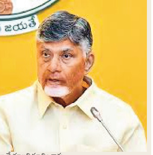
అమలు చేయాలని సూచించారు. ప్రభుత్వ సేవలను మరింత పారదర్శకంగా, వేగవంతంగా అందించేందుకు అత్యవసర సేవలు మినహా మిగతా అన్ని సేవలను ఆన్లైన్లోకి తీసుకురావాలని సీఎం స్పష్టం చేశారు. ప్రజాతో నేరుగా మమేకం కావడానికి అధికారులు క్షేత్రస్థాయిలో పర్యటించాలని, సీనియర్ అధికారులు, హెచ్ఓఓలు, జిల్లా కలెక్టర్లు నిర్దిష్ట రోజులు ప్రజల మధ్య ఉండాలని దిశానిర్దేశం చేశారు. ప్రజాభిప్రాయ సేకరణ కోసం కాలే సెంటర్ వ్యవస్థను బలోపేతం చేయాలని సూచించారు. రైతులకు పంటల ధరల విషయంలో ఇబ్బందులు లేకుండా మార్కెట్లను నిరంతరం విశ్లేషించి తగిన చర్యలు తీసుకోవాలని కూడా సీఎం ఆదేశించారు.

సులభతరంగా వాహన రిజిస్ట్రేషన్లు అదనపు వాహన రిజిస్ట్రేషన్ లభారణిగా వాహన డిలర్లు ప్రభుత్వ సేవల్లో ఘన వినియోగంపై సలహా మండలి వివిధ శాఖలపై ఆర్టిజిఎస్ సుంక సీఎం చంద్రబాబు సమీక్ష ముద్ర, అమరావతి : ముద్ర, అమరావతి : రాష్ట్రంలో ఎక్కడా మంచినీటి కొరత తలెత్తకుండా ముందస్తు చర్యలు చేపట్టాలని ముఖ్యమంత్రి చంద్రబాబు నాయుడు అధికారులను ఆదేశించారు. నీటి సరఫరా కోసం జిల్లా కలెక్టర్లకు రూ.1 కోటి చొప్పున నిధులు విడుదల చేయాలని సీఎం ఆదేశించారు. అవసరమైన ప్రాంతాల్లో ట్యాంకర్ల ద్వారా నీటి సరఫరా చేయడంతో పాటు పనీచేయని బోర్లను వెంటనే మరమ్మత్తులు చేయాలని సూచించారు. రాష్ట్రంలో వాహనాల రిజిస్ట్రేషన్ ప్రక్రియను మరింత సులభతరం చేయడానికి వాహన డిలర్లను అదనపు రిజిస్ట్రేషన్ అథారిటీగా గుర్తించే దిశకు సీఎం ఆహ్వానం తెలిపారు. దీంతో రిజిస్ట్రేషన్ ప్రక్రియను వేగవంతం చేసి 24 గంటల్లో పూర్తిచేయాలని లక్ష్యంగా పెట్టుకున్నారు. రాష్ట్ర సచివాలయంలోని ఆర్టిజిఎస్ కేంద్రం నుంచి వివిధ శాఖల పనితీరుపై సమీక్ష నిర్వహించిన సీఎం, ప్రభుత్వ సేవల్లో ఆర్టిజిఎస్ కేంద్రం ఇంటిగ్రేషన్ వినియోగాన్ని పెంచేందుకు నిపుణులతో కూడిన సలహా మండలి ఏర్పాటు చేయాలని సూచించారు. వేసవి తీవ్రత దృష్ట్యా ప్రజలకు వడదెబ్బ నుంచి రక్షణ కల్పించేందుకు మంచినీరు, మజ్జిగ్, ఓఆర్ఎస్ పంపిణీ చేయాలని అధికారులను ఆదేశించారు. ఇందుకు స్వచ్ఛంద సంస్థల సహకారం కూడా తీసుకోవాలని స్పష్టం చేశారు. అలాగే అవేరి సాంకేతికతను ఉపయోగించి ప్రజలకు జాగ్రత్తలపై అవగాహన కల్పించాలన్నారు. మైనింగ్ కార్యకలాపాల్లో డ్రోన్ సాంకేతికత వినియోగాన్ని పెంచేందుకు ఇతర రాష్ట్రాల్లో అమలు చేస్తున్న విధానాలను అధ్యయనం చేసి ఏపీలో