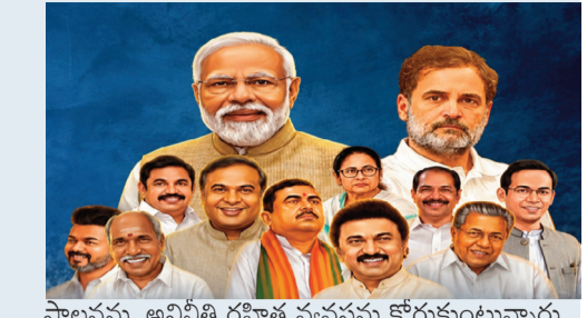
పాలనను, అవినీతి రహిత వ్యవస్థను కోరుకుంటున్నారు. పాలనలో విఫలమైతే, ఓటరు ఎంతటి బలమైన నాయకుడినైనా ఇంటికి పంపేస్తారని ఈ రోజు ఫలితాలు మరోసారి చాటిచెప్పాయి.

కుపోవడం చూస్తుంటే, బెంగాల్ ప్రజలు హింసాత్మక రాజకీయాలను, అవినీతి అక్రమాలను ఎంతగా వివేకించుకున్నారో అర్థమవుతోంది. "మా మట్టిలో మార్పు రావాలి" అనే బెంగాలీ ప్రజల నినాదం నేడు ఓట్ల రూపంలో ప్రభంజనమైంది. ఇది కేవలం ఒక పార్టీ గెలుపు కాదు, నిరంకుశత్వానికి వ్యతిరేకంగా సామాన్య ఓటరు సాధించిన విజయం.