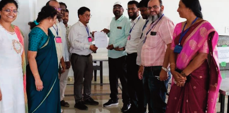
ముద్ర ప్రతినిధి, నాగర్ కర్నూల్: