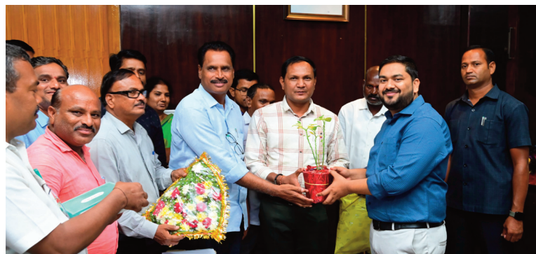
ముద్ర ప్రతినిధి, నాగర్ కర్నూల్:

పదో తరగతి ఫలితాల్లో నాగర్ కర్నూల్ జిల్లా రాష్ట్ర స్థాయిలో ద్వితీయ స్థానాన్ని సాధించి విశేష ప్రతిభ చాటుకుంది. మొత్తం 10,641 మంది విద్యార్థులు పరీక్షలకు హాజరు కాగా, 10,538 మంది ఉత్తీర్ణత సాధించారు. జిల్లాలోని 254 పాఠశాలల్లో 208 పాఠశాలలు 100 శాతం ఫలితాలు సాధించగా, వాటిలో 149 ప్రభుత్వ పాఠశాలలు ఉండటం ప్రత్యేకత. అలాగే 20 కేజీబీవీ