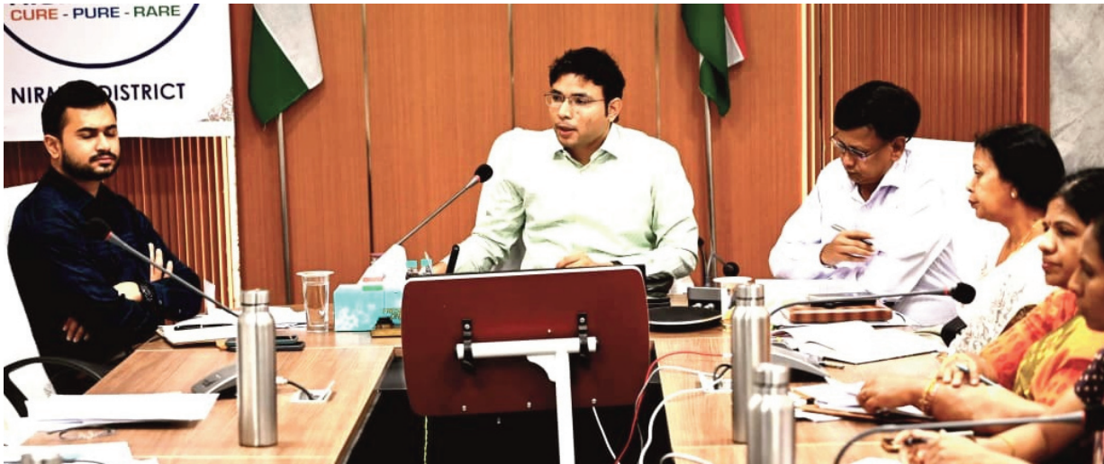
అధికారులు తదితరులు పాల్గొన్నారు. పాస్పర్ల ఆవిష్కరణ.. అనంతరం మే 6న నిర్వహించనున్న ఉద్యోగ మేళా పోస్టర్లను ఆవిష్కరించారు.

-నిర్మల్ కలెక్టర్ భవేష్ మిశ్రా ముద్ర ప్రతినధి, నిర్మల్: జిల్లాలో ఇసుక అక్రమ రవాణాను పూర్తి స్థాయిలో అరికట్టాలని కలెక్టర్ భవేష్ మిశ్రా అధికారులను ఆదేశించారు. బుధవారం ఇసుక అక్రమ రవాణా సహా పలు అంశాలపై అధికారులతో సమావేశం నిర్వహించారు. ఈ సందర్భంగా ఆయన మాట్లాడుతూ అధికారులు ఇసుక అక్రమ రవాణాపై నియంత్రణ ఉంచాలని తెలిపారు. నిబంధనల ప్రకారమే ఇసుక అమ్మకాలు జరగాలని పేర్కొన్నారు. ఇసుక అక్రమ తవ్వకాలు, రవాణా నియంత్రణపై అలసత్వం వహిస్తే కఠిన చర్యలు ఉంటాయని హెచ్చరించారు. భూ భారతి దరఖాస్తులు వెంటనే పరిష్కరించాలని చెప్పారు. ప్రజావాణి దరఖాస్తులు ఎప్పటికప్పుడు పరిష్కరించాలని ఆదేశించారు. ఎన్ఐఆర్ కు సంబంధించి ఓటర్ ప్రోజెని మ్యాపింగ్ ప్రక్రియను త్వరితగతిన పూర్తి చేయాలన్నారు. సెల్ఫ్ ఎన్ఫోర్స్ మెంట్ ప్రక్రియ పూర్తి చేసేలా అధికారులు చర్యలు తీసుకోవాలని తెలిపారు. ఈ సమావేశంలో అదనపు కలెక్టర్ (రెవెన్యూ) కిషోర్ కుమార్, బైంసా సబ్ కలెక్టర్ అజీరా సంతేష్ అధికారులు తదితరులు పాల్గొన్నారు.